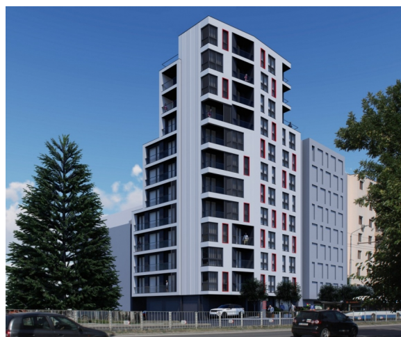
СГРАДА FLAME LILY